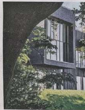
Den nya konsthallen och kulturhuset Ravinen.