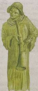
Danilo Stankovic, "Ingen tid skall mer givas", 2020, akvarell.