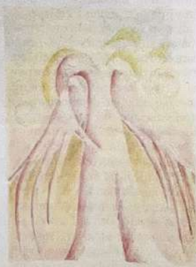
Emelie Sandström, "Mellan himmel och jord", 2021, torrpastell.