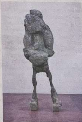
Max Ockborn, "Om du glittrar men du dog", 2020, skulptur i mixed media.