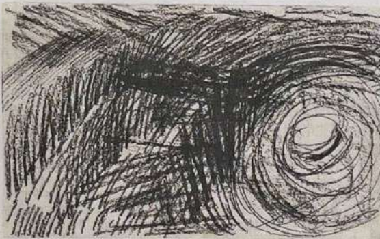
Carl Fredrik Hill, teckning utan årtal och titel (Malström).